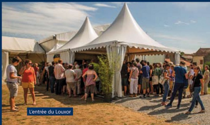
L'entrée du Louxor