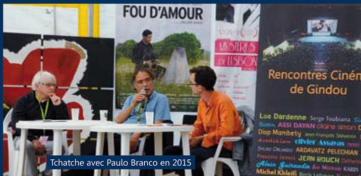
Tchatte avec Paulo Branco en 2015