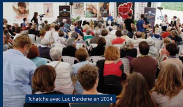
Tchatte avec Luc Dardene en 2014