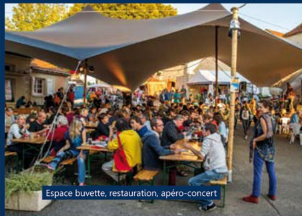
Espace buvette, restauration, apéro-concert