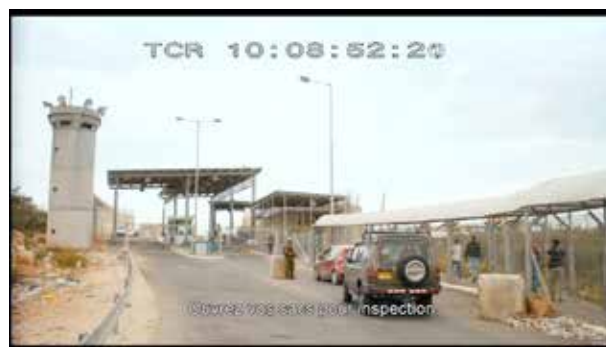
Le check-point, lieu de passage contrôlé par les Israéliens, constitue un point de tension particulier dans le film