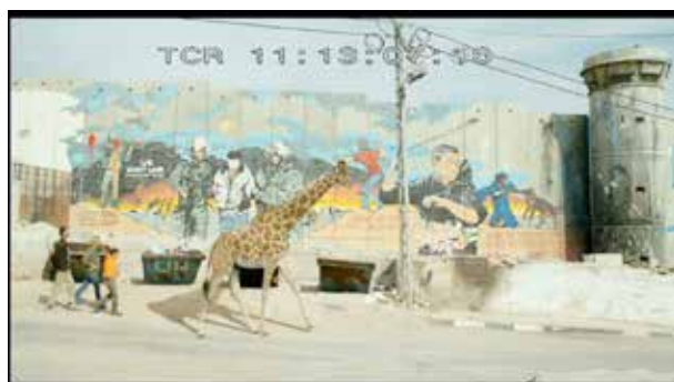
Rencontre entre le réel et le merveilleux