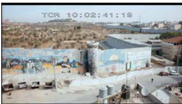
On aperçoit d'un côté la ville et de l'autre les terres auxquelles les Palestiniens n'ont plus accès.

Le conflit israélo-palestinien est évoqué en premier lieu par la présence imposante du mur de séparation, par le check-point que les personnages doivent traverser pour passer d'un territoire à l'autre, mais aussi par les affrontements physiques entre la population et l'armée israélienne. Le conflit est dans toutes les bouches : une réunion a lieu avec les habitants de Qalqilya où il est question du mur, et à la radio la deuxième Intifada est le sujet d'information principal : « Sept Palestiniens tués et trois soldats israéliens blessés dans les heurts (...) l'intifada doit rester pacifique ». Tous ces éléments s'imposent tout au long du film et participent à l'ancrer dans la complexité du réel.