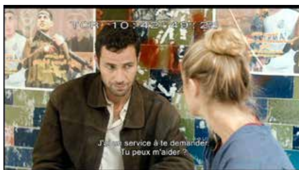
Affiche d'un soldat à l'arrière-plan : la violence est latente

Au principe d'opposition se superpose l'idée d'une cohabitation entre deux univers a priori distincts. Celui de la fiction et du réel bien sûr, du conte et du principe de réalité : le film déploie dans le même mouvement une histoire enfantine, avec tout ce qu'elle peut comporter de merveilleux (c'est la thématique du « miracle » qui est évoquée à plusieurs reprises) et les conditions de vie des Palestiniens. Les photogrammes ci-dessous constituent des exemples parlants de cette ambivalence :